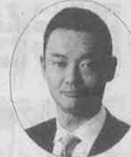
代表幹事 中田 宏 (前 横浜市長)