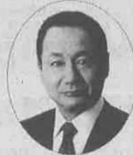
党首 山田 宏 (前 杉並区長)