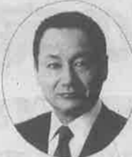
党首 山田 宏 (前 杉並区長)