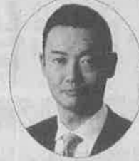
代表幹事 中田 宏 (前 横浜市長)