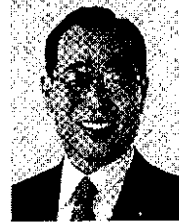
魚住 ゆいちろう 現 弁護士、元厚生、元総務省副大臣、早稲田大学卒、60歳。まっすぐ、政策実現!