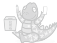
啓発マスコット トリヒョウザウルス きめたろう

この選挙公報は、候補者から提出された原稿を、そのまま写真製版により印刷したものです。掲載順序は、くじによって決めました。