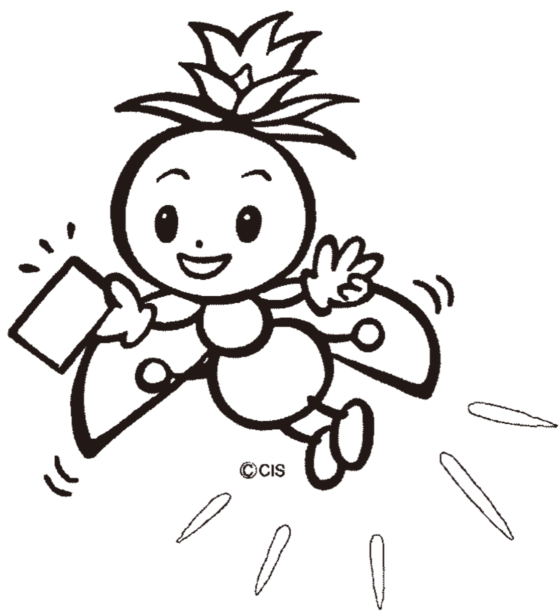
長野県選挙啓発マスコットキャラクター ほたりちゃん

仕事や旅行などの理由で、投票日当日に投票できない方は、 12月13日(土)まで期日前投票ができます