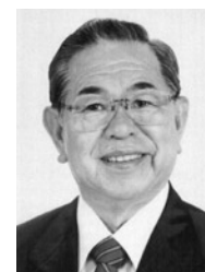
野本三雄 (77) 自由民主党