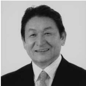
福岡市議会議員候補 (自由民主党)