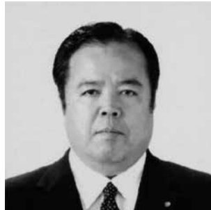
公明党公認 市議会議員候補 南区